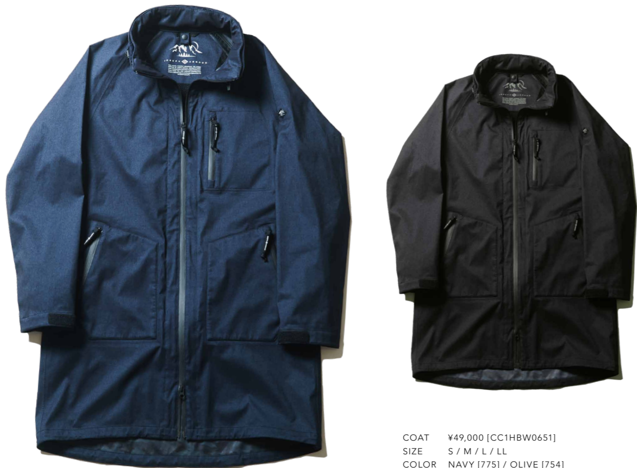
COAT ¥49,000 [CC1HBW0651] SIZE S / M / L / LL COLOR NAVY [775] / OLIVE [754]