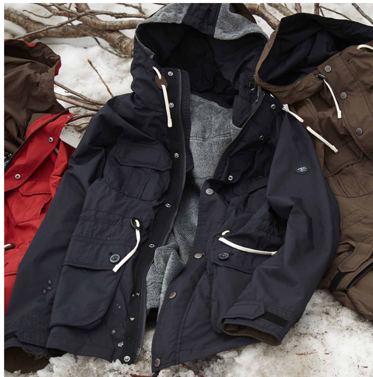
INNER FLEECE (P7-8) BLOUSON_¥24,000 [KK1HBW0650/004]

環境に配慮したエコエリート撥水加工を生地表面にほどこしたマウンテンジャケット。少々の雨や水濡れは気になりません。別売りのフリース (P7-8) をファスナーで着脱できるため、気温の変化に対応した幅広い着こなしが可能です。また、着心地の良い軽量のナイロン素材を使用しており、多数のポケットで収納力を高めているのも特徴です。